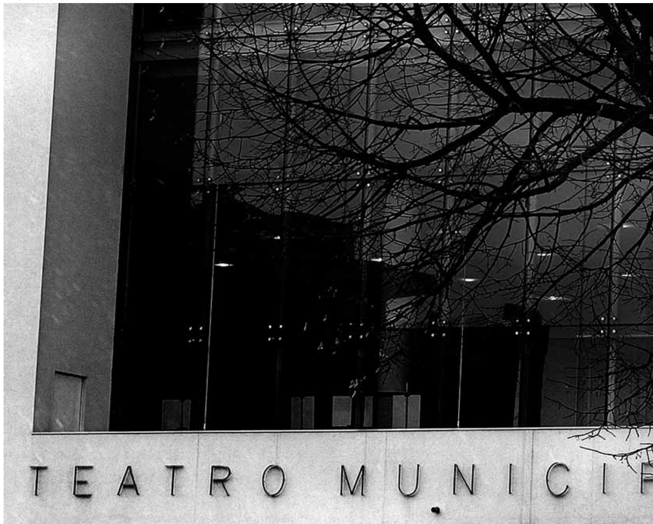
Muitos agentes culturais afirmam que sem os subsídios desapareceria a diversidade da oferta e os preços dos bilhetes disparariam