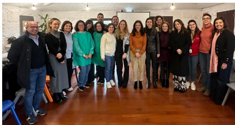
Projeto Portas Abertas - Apoio às pessoas em situação de Sem Abrigo