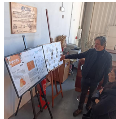
Projeto ECOS - Oficina Ecológica de Cooperação Social (Santa Casa da Misericórdia de Albufeira)