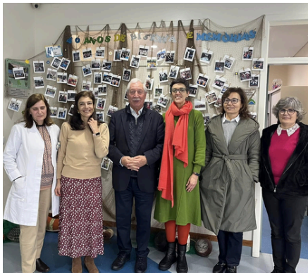
Centro Social e Cultural de Vila Praia de Ancora