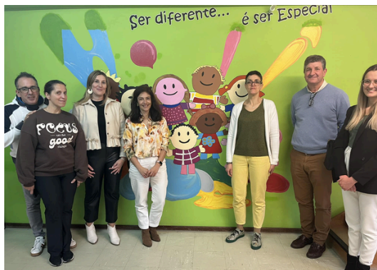
Associação para a Educação de Crianças Inadaptadas de Torres Vedras