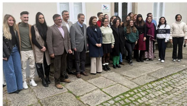
Amato Lusitano - Associação de Desenvolvimento