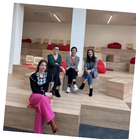
TUMO - Coimbra