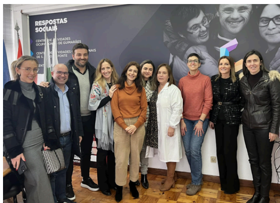
Projeto I9 com a Diferença – Apoio à pessoa com deficiência - CERCIGUI