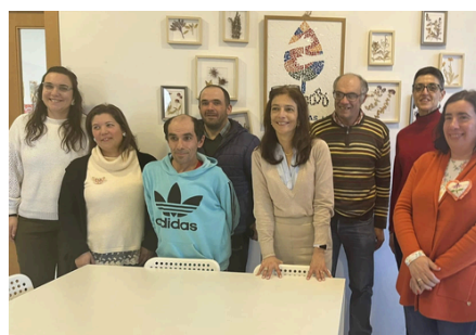
Projeto BIOAromas Centro Ciência Viva da Floresta - Proença a Nova