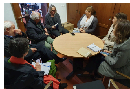
Gabinete de Atendimento à Família de Viana do Castelo