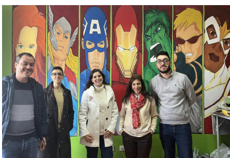
Projeto Pontes de Inclusão – Fundação Casa do Trabalho