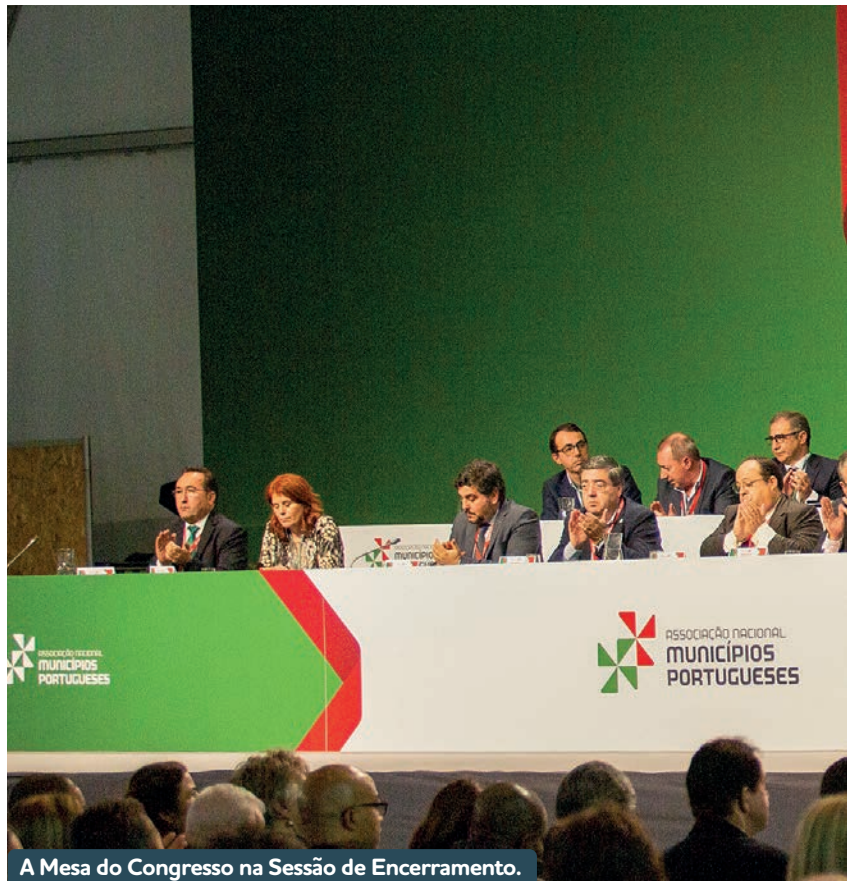
A Mesa do Congresso na Sessão de Encerramento.

As intervenções dos oradores encontram-se disponíveis no site da ANMP na rúbrica relativa ao XXIV Congresso.