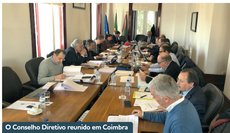
O Conselho Diretivo reunido em Coimbra

a distribuição mais equitativa de verbas pelos 308 Municípios, que garante que não só nenhum Município desce, como todos os Municípios sobem face ao ano anterior (39 Municípios sobem até 5% e 269 sobem entre 5 e 10%).