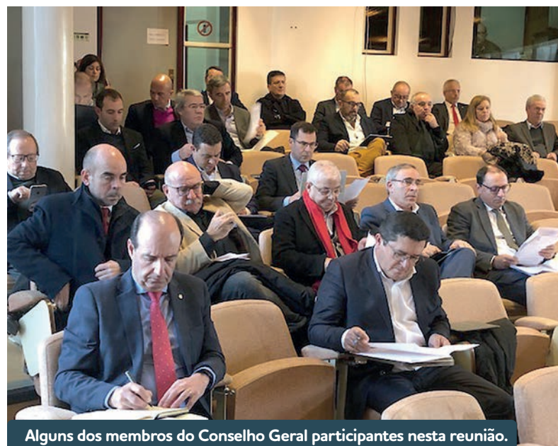
Alguns dos membros do Conselho Geral participantes nesta reunião.

Este parecer, que pode ser consultado no site da ANMP, apresenta os aspetos positivos e os negativos e omissos, da referida Proposta de Lei do Orçamento do Estado para 2020 que a ANMP exigiu que fossem resolvidos pelo Governo e pela Assembleia da República. O Conselho Geral, órgão máximo entre Congressos, aprovou, também, o Relatório de Atividades e Contas da ANMP para 2020, que inclui diversos temas, nomeadamente a descentralização, a Lei de Finanças Locais e os Fundos Europeus Estruturais e de Investimento fundamentais para o desenvolvimento do País.