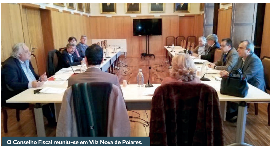
O Conselho Fiscal reuniu-se em Vila Nova de Poiares.

das as disponibilidades financeiras da Associação. Relativamente ao plano de atividades, igualmente aprovado, o Conselho Fiscal sublinhou a preocupação do Conselho Diretivo em prosseguir os fins de defesa, afirmação, unidade e dignificação do Poder Local para os quais foi criada esta Associação.