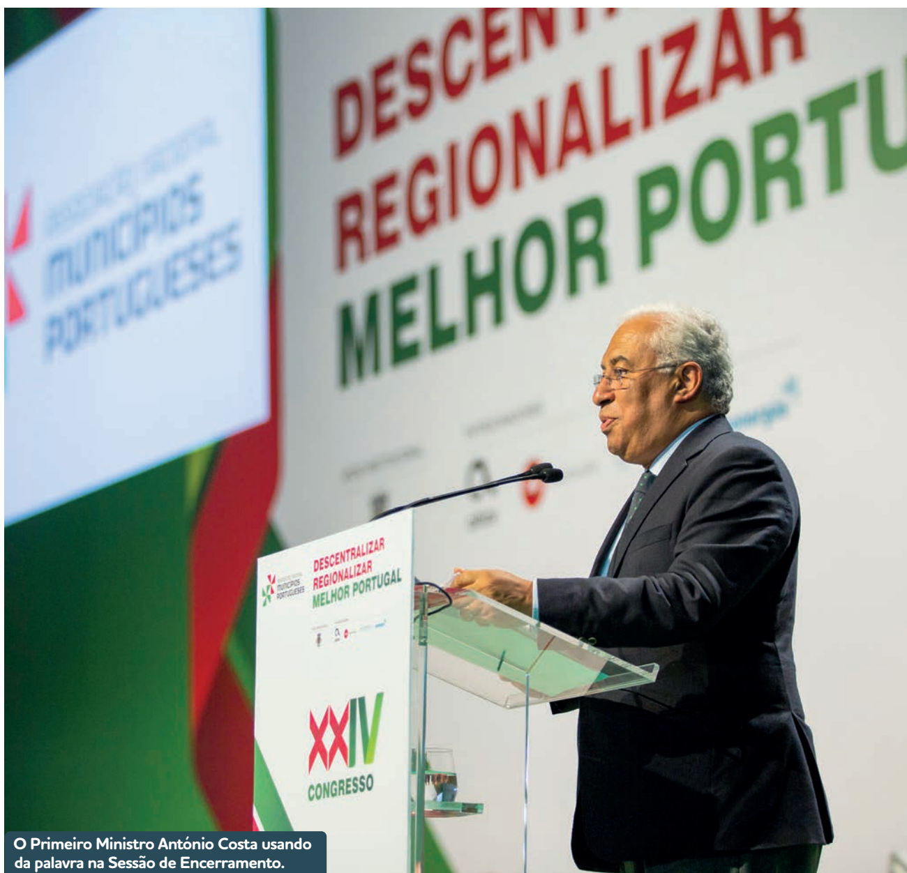
O Primeiro Ministro António Costa usando da palavra na Sessão de Encerramento.