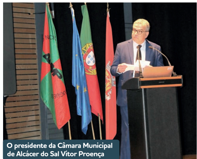
O presidente da Câmara Municipal de Alcácer do Sal Vitor Proença

Este projeto tem como objetivo criar uma metodologia que permita o desenvolvimento de plataformas municipais de gestão de informação (PGI). Esta metodologia permitirá aproximar os Municípios do conceito de cidades inteligentes e de proporcionar um crescimento conjunto, a partir da troca de informação entre Municípios, Administração Pública e entidades privadas. Trata-se de um estudo que tem como ambição a identificação de formas de superar as limitações existentes atualmente para a obtenção de PGIs totalmente integradas em todas as áreas de intervenção dos Municípios e que permitam a utilização do conceito de dados abertos, atingindo assim a interoperabilidade entre sistemas.