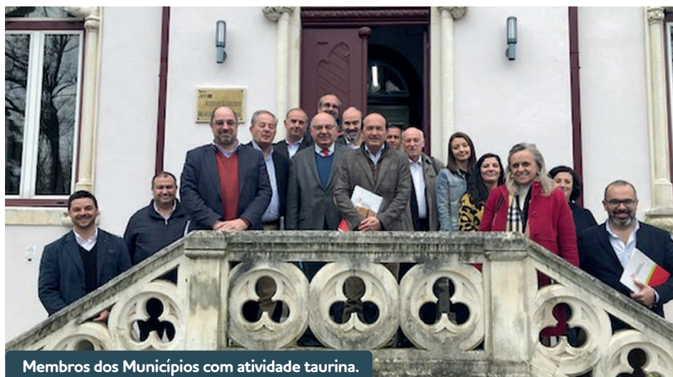
Membros dos Municípios com atividade taurina.