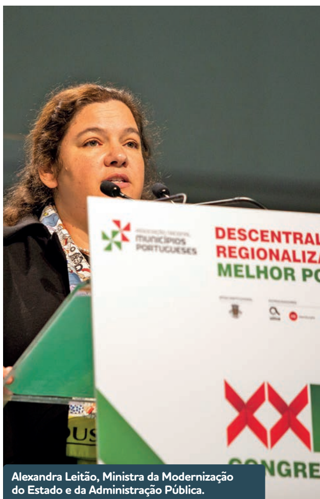
Alexandra Leitão, Ministra da Modernização do Estado e da Administração Pública.