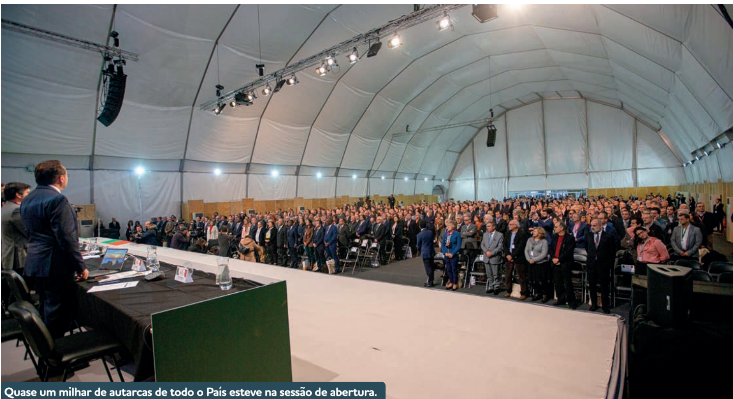
Quase um milhar de autarcas de todo o País esteve na sessão de abertura.

um programa de ação para os próximos tempos, apresentando propostas e soluções em cada uma destas áreas determinantes para o futuro de Portugal. Na Sessão de Abertura, presidida pelo Presidente da República Marcelo Rebelo de Sousa, participaram