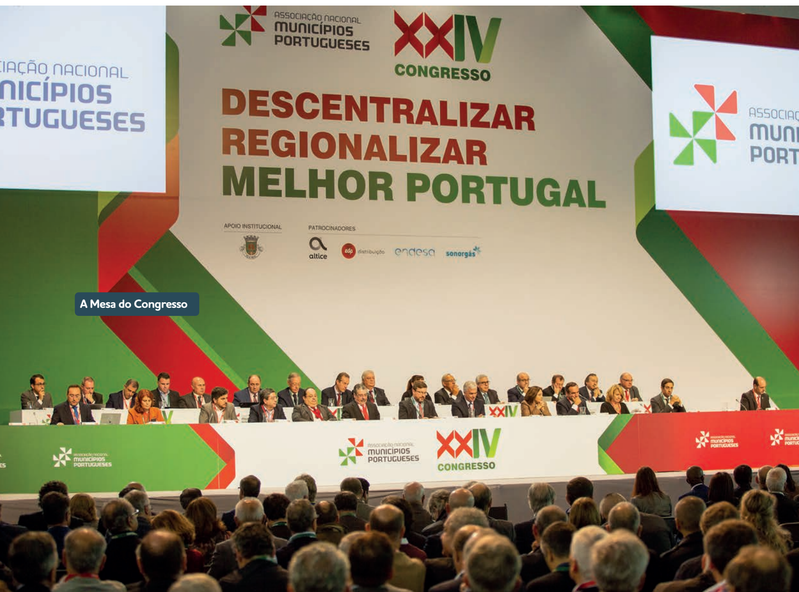
A Mesa do Congresso

XXIV CONGRESSO SOB O SIGNO DESCENTRALIZAR. REGIONALIZAR. MELHOR PORTUGAL