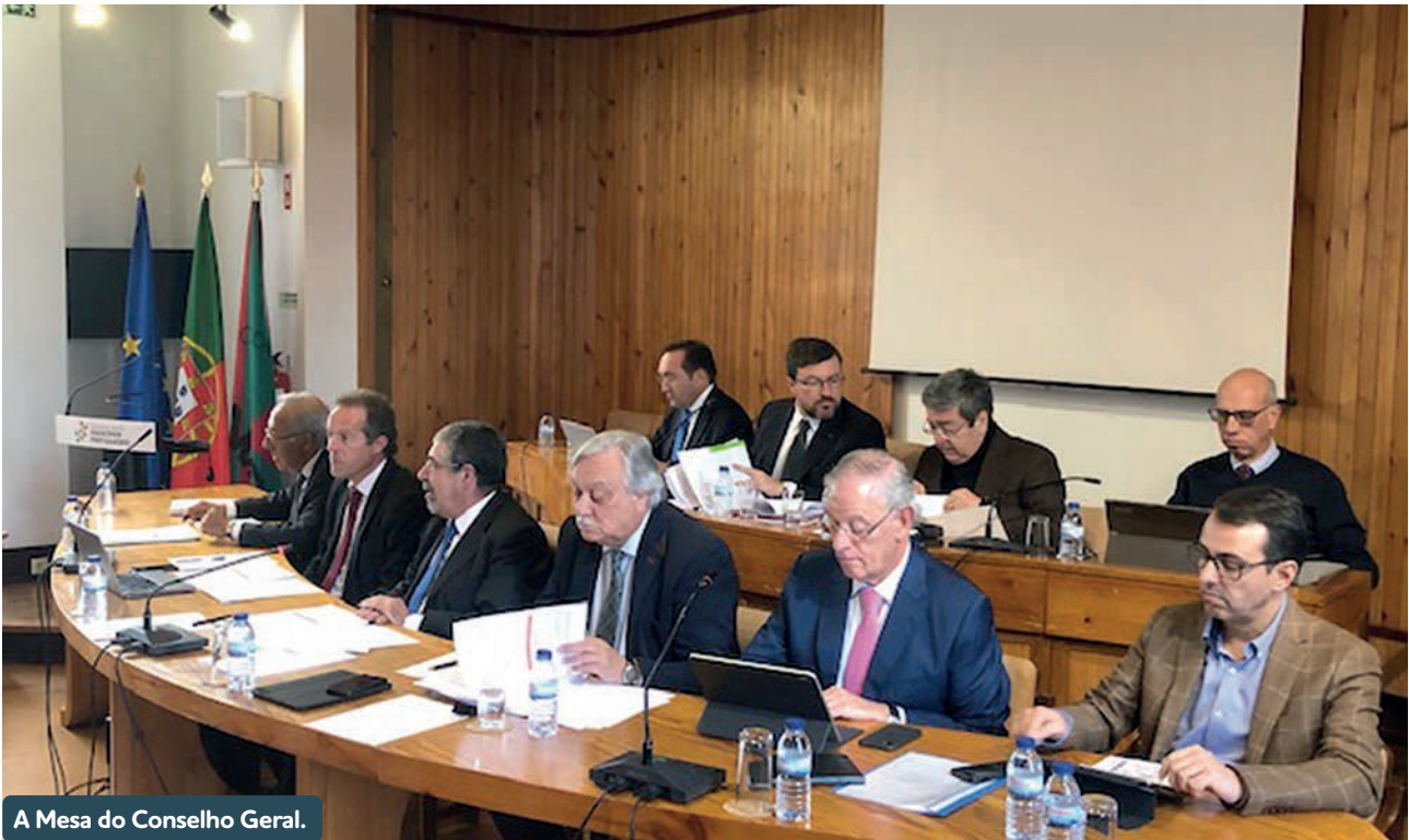
A Mesa do Conselho Geral.

O Conselho Geral da Associação Nacional de Municípios Portugueses (ANMP) aprovou, na sua reunião de 21 de janeiro (2020), por unanimidade, o parecer desfavorável à Proposta de Lei do Orçamento do Estado (PLOE) para 2020 proposto pelo Conselho Diretivo da Associação.