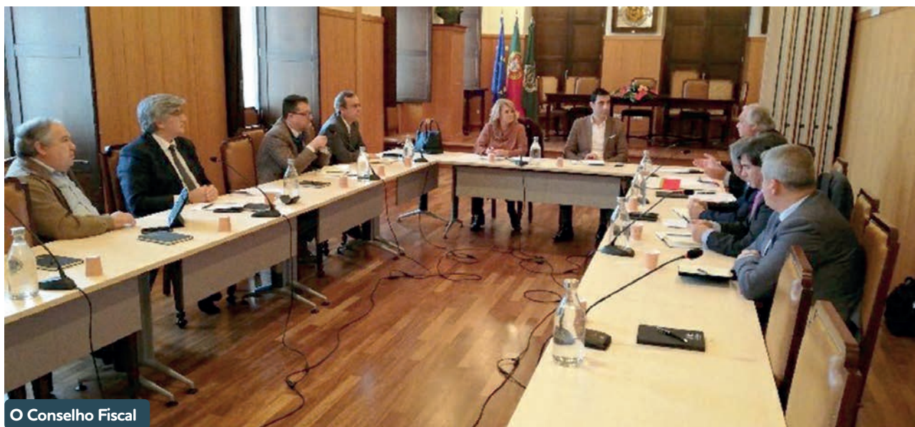
O Conselho Fiscal