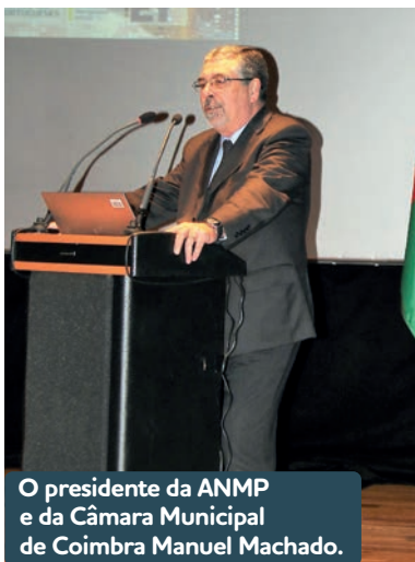
O presidente da ANMP e da Câmara Municipal de Coimbra Manuel Machado.