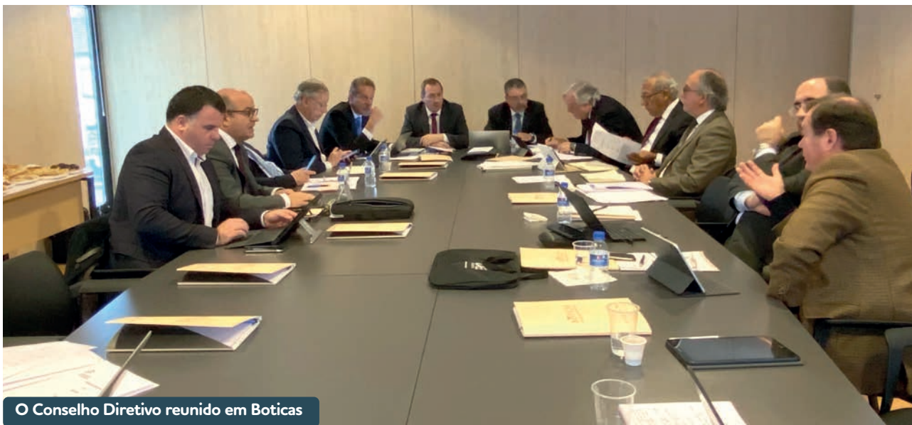
O Conselho Diretivo reunido em Boticas

Neste ano de 2020, o Conselho Diretivo da Associação Nacional de Municípios Portugueses (ANMP) já realizou três reuniões, duas na sede da Associação, em Coimbra - a 14 de janeiro e a 11 de fevereiro e uma no dia 28 de janeiro no Município de Boticas, para discutir vários assuntos relevantes para o Poder Local, com particular destaque para a Proposta de Lei do Orçamento do Estado para 2020.