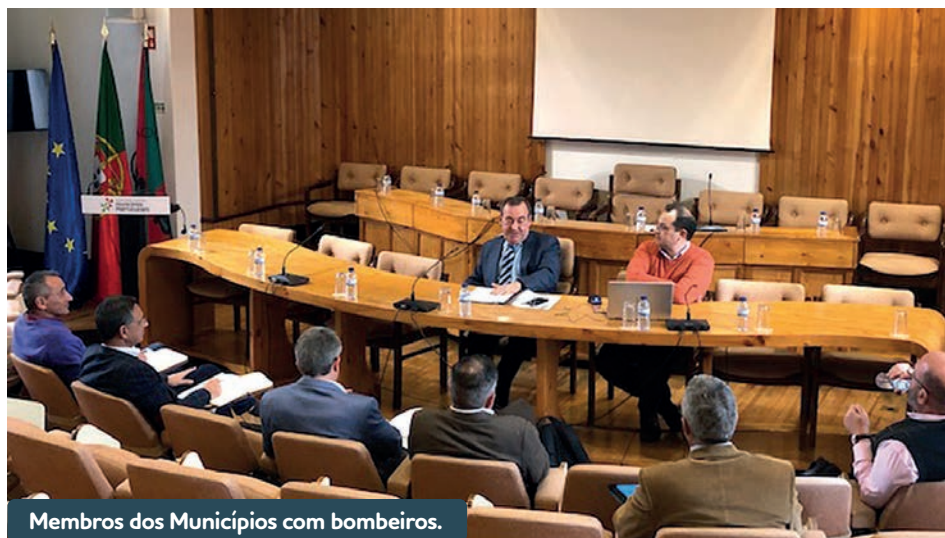
Membros dos Municípios com bombeiros.