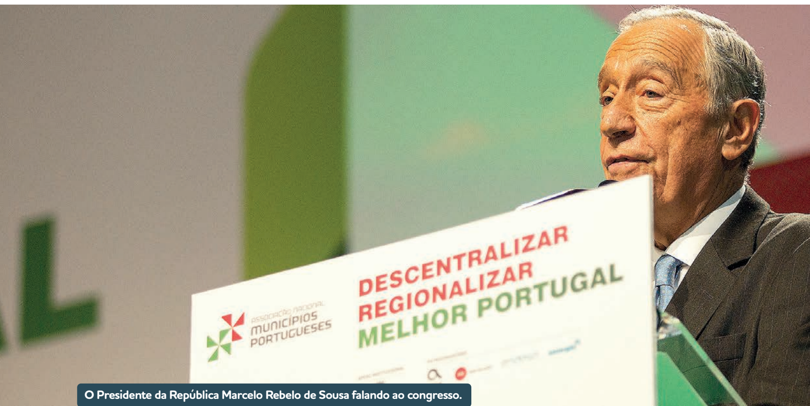
O Presidente da República Marcelo Rebelo de Sousa falando ao congresso.