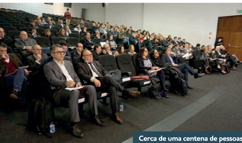
Cerca de uma centena de pessoas assistiram a esta primeira sessão.