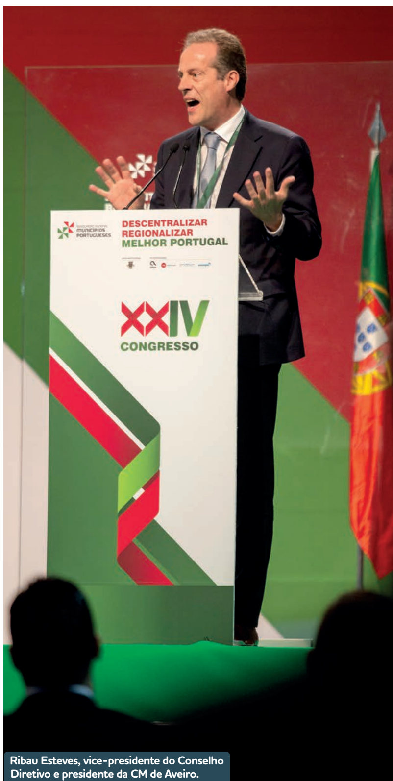
Ribau Esteves, vice-presidente do Conselho Diretivo e presidente da CM de Aveiro.

O documento sobre o “Financiamento Local”, que foi distribuído aos congressistas, encontra-se disponível no site da ANMP na rúbrica relativa ao XXIV Congresso.