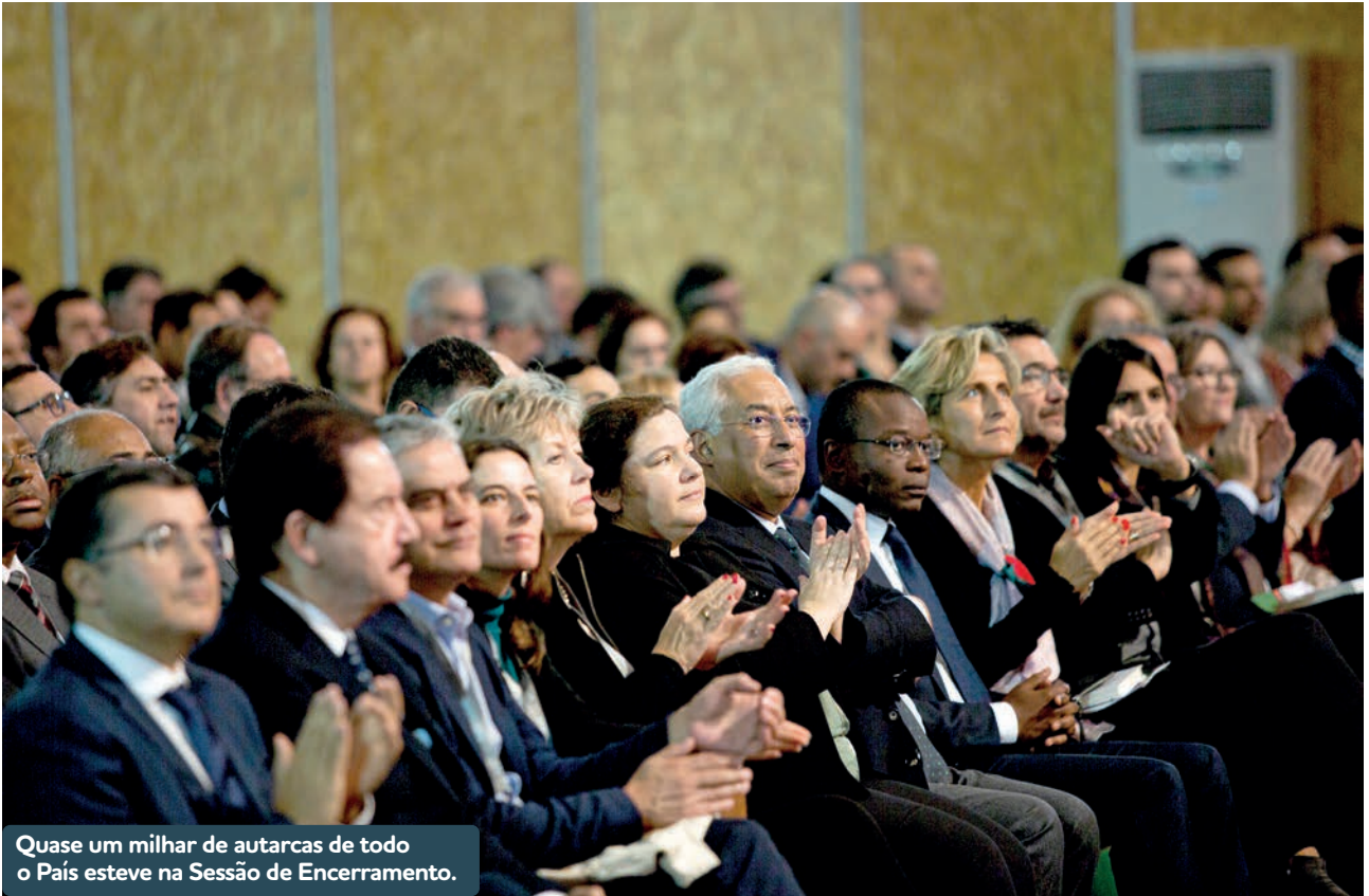
Quase um milhar de autarcas de todo o País esteve na Sessão de Encerramento.

melhor solução para o desenvolvimento do território, porque essa passa obrigatoriamente pela constituição de autarquias regionais, é, pelo menos um primeiro passo para a democratização destas entidades que, atualmente, têm corpos dirigentes nomeados pelo Governo, sendo uma espécie de braço armado do Estado Central no território quando têm por missão defender os interesses das populações das respetivas regiões. Pela ANMP, o presidente Manuel Machado reiterou a visão regionalista da Associação, assumida desde o Congresso de Tróia, em 2015, sublinhando que a descentralização em curso é fundamental para aproximar o Estado dos cidadãos, fazer mais e melhor pelas comunidades, concluindo que a regionalização terá de ser o passo seguinte, pois as regiões são a única forma de criar um país mais equilibrado e mais igualitário, como, de resto, sucede em todos os países europeus em que há regiões administrativas – que são a maioria.