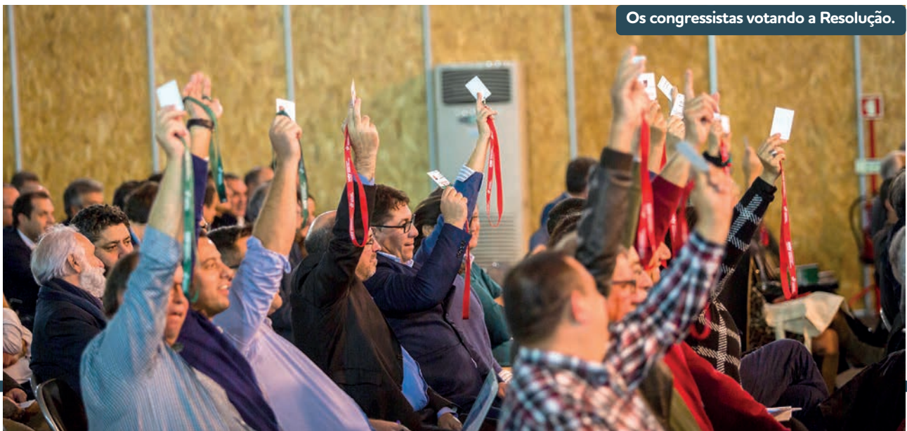
Os congressistas votando a Resolução.

ção a esta Resolução, relativa à necessidade de audição dos eleitos locais relativamente “[...] à reposição das freguesias extintas em 2013, num processo simples e rápido, de modo a que possa ser posto em prática antes das eleições autárquicas de 2021”, que foi aprovada por maioria com uma abstenção, pelo que foi integrada na Resolução que foi distribuída aos congressistas e aprovada por maioria, encontrando-se disponível no site da ANMP na rúbrica relativa ao XXIV Congresso.