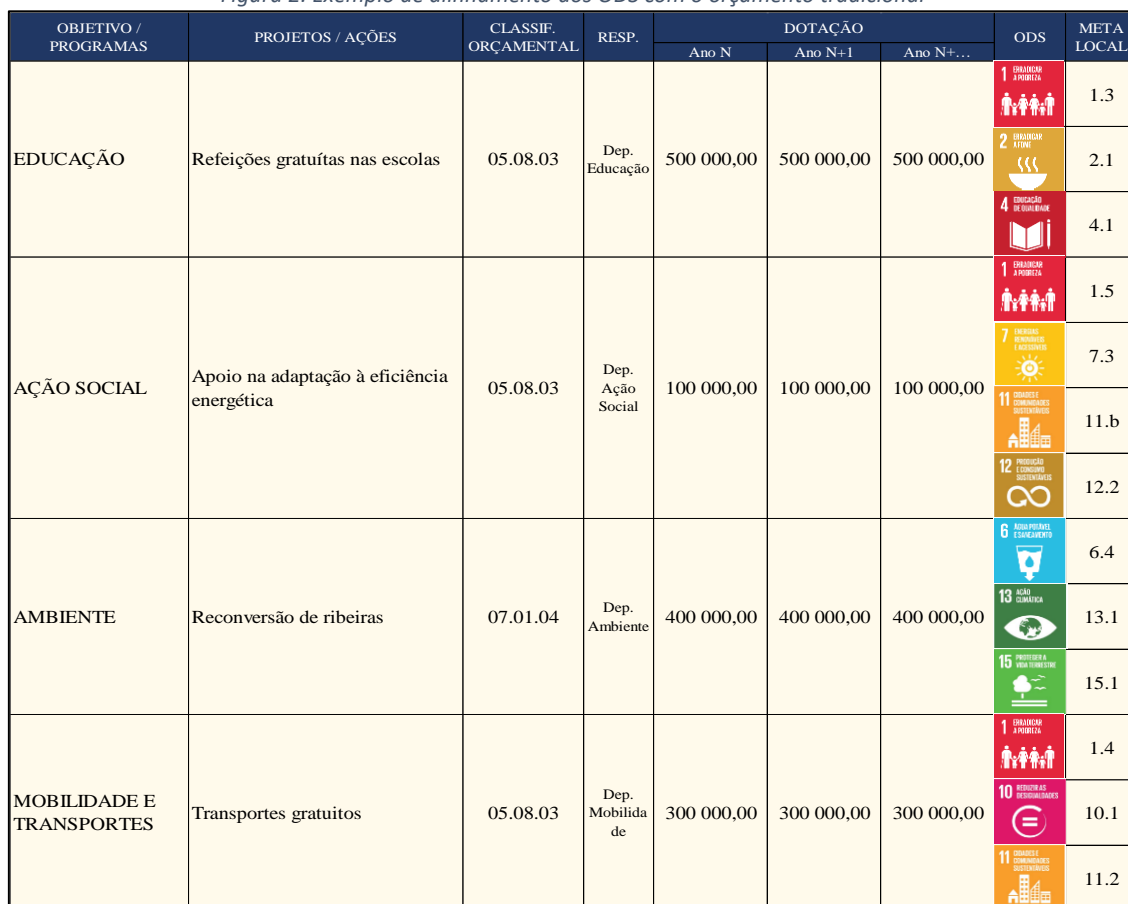
Figura 2: Exemplo de alinhamento dos ODS com o orçamento tradicional