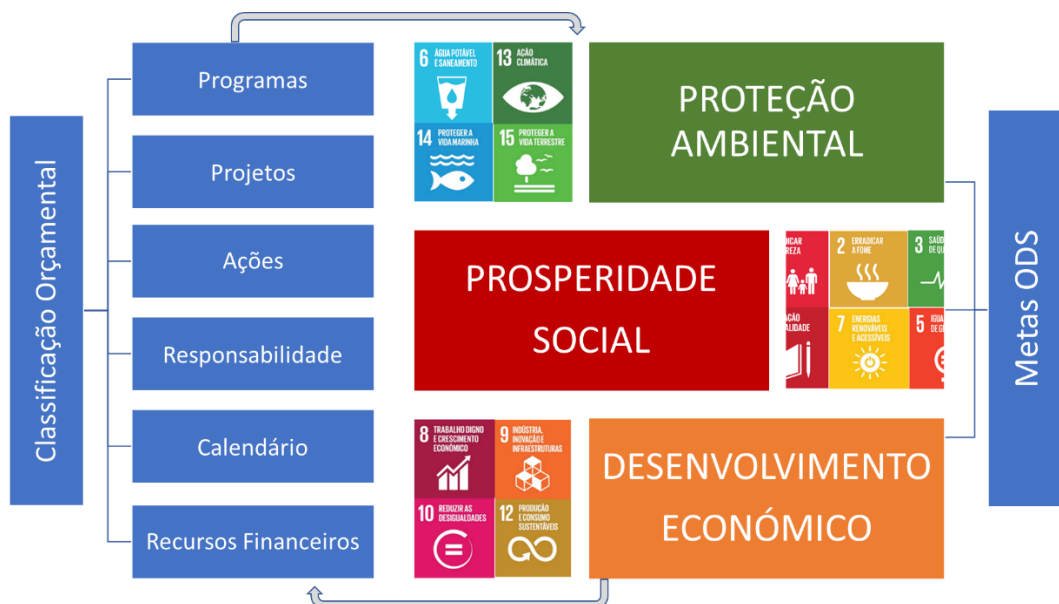
Figura 1: Matriz de alinhamento entre a classificação orçamental e as metas dos ODS

Embora os municípios utilizem instrumentos paralelos para monitorização das estratégias locais de desenvolvimento, a avaliação de sustentabilidade requer o estabelecimento de metas e resultados vinculados a uma hierarquia semelhante à do plano de contas, pelo que o seu alinhamento possibilita a gestão integrada do orçamento e dos resultados a atingir, conforme se exemplifica de forma conceptual na figura seguinte: