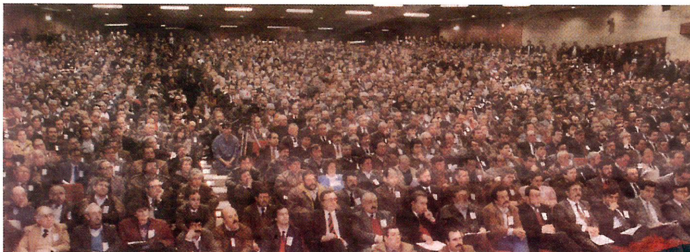
Alfredo Cunha - Público