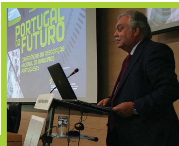
Rui Solheiro, Secretário-Geral da ANMP

As Conferências Portugal do Futuro, da ANMP, vão continuar em 2015. Outros temas, outros conferencistas, outros moderadores, todos empenhados na construção de um país melhor para todos os portugueses. Todos, por isso, em busca de contributos diversos e plurais. Para a ANMP, está tudo em aberto e o que mais importa alcançar é um conjunto de propostas que contribuam, de facto, para um novo país.