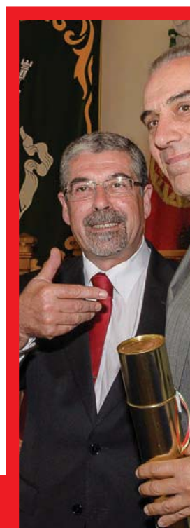
Homenagem a Alberto Santos