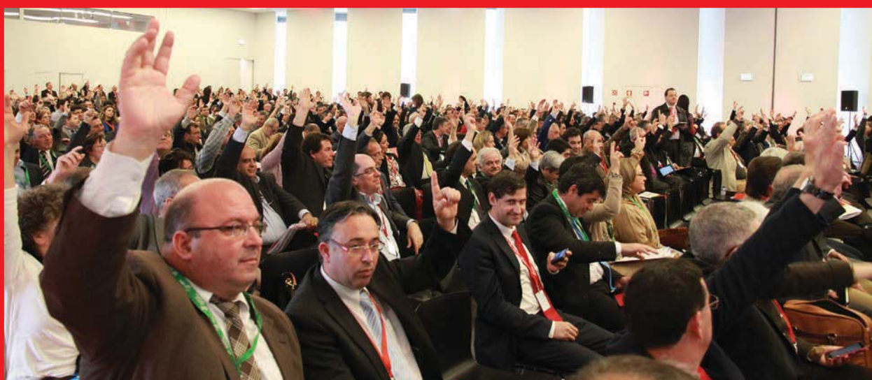
Sem votos contra, apenas 62 abstenções, e votos a favor de esmagadora maioria do Congresso, foi aprovada a resolução final