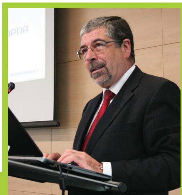
O presidente da ANMP apresentou a proposta de Fundo de Equilíbrio Tarifário

A ANMP estudou, “atempadamente, a criação de um mecanismo que permite corrigir a disparidade tarifária resultante dos condicionalismos associados à prestação deste serviço” e “agora, perante o lançamento, pelo Governo, de um ‘Plano de Reestruturação do Setor das Águas - Ciclo Urbano’, os municípios entendem que “o mais indicado para o setor é a criação e instituição pelo Estado de um FET”, concluiu o presidente da ANMP.