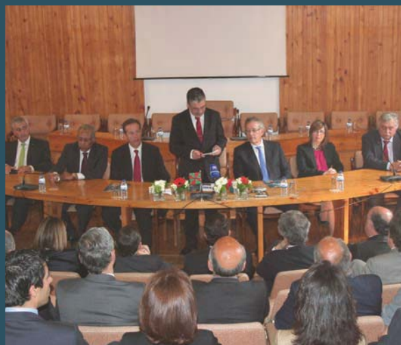
O conselho diretivo recebeu os autarcas