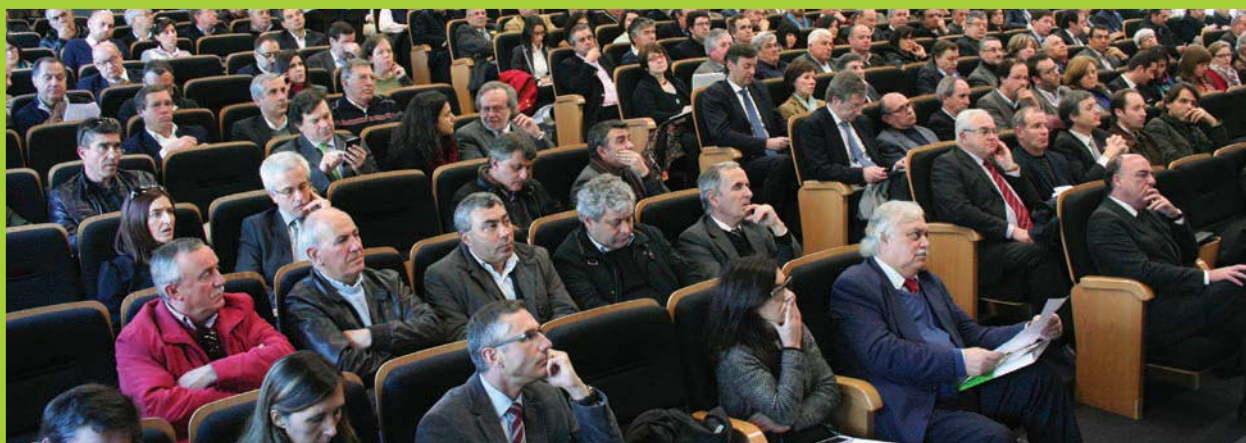
Mais de duas centenas de autarcas e técnicos ligados ao setor das águas participaram no debate