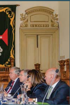
...os descerraram uma lápide