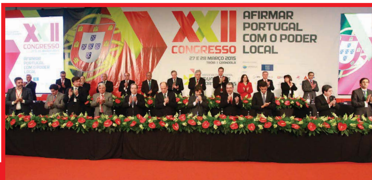
Palmas finais para o Poder Local Democrático