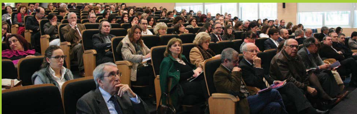
Vieram de todo o país para debaterem a relação entre o Poder Local e o setor solidário