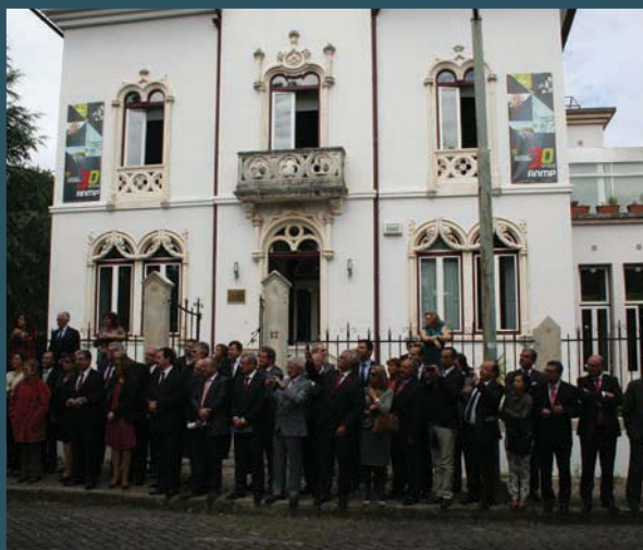
A sede da ANMP abriu as portas à comunidade