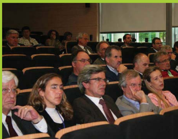
Esta conferência nacional acolheu o interesse de pessoas de várias áreas profissionais