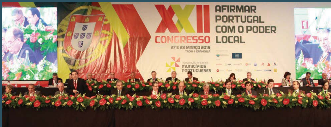
A mesa do Congresso na Sessão de Abertura em Tróia