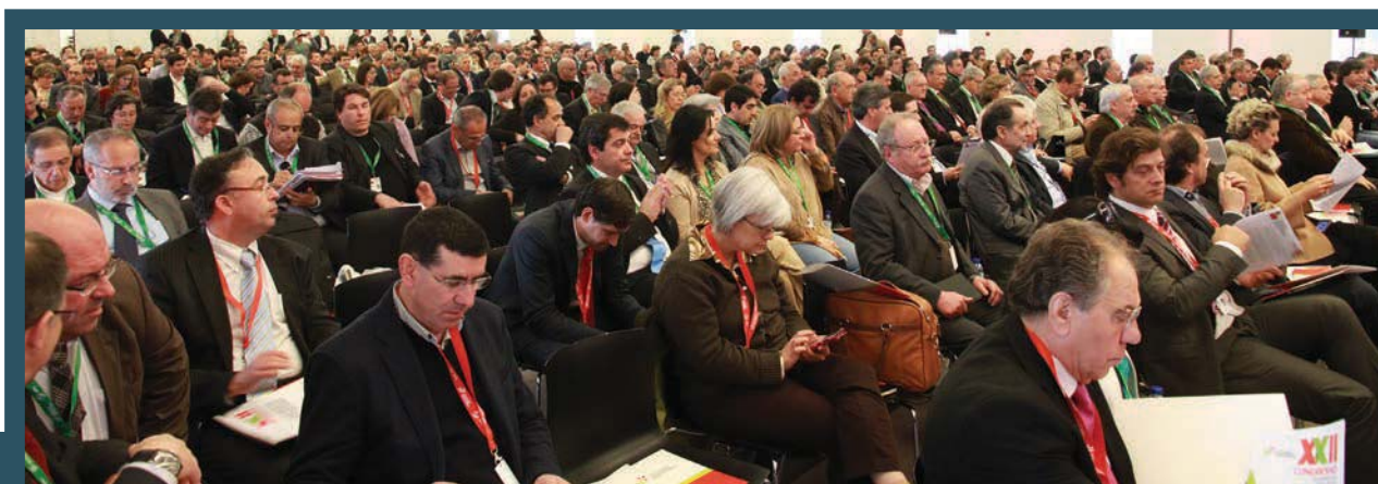
A esmagadora maioria dos municípios esteve presente neste Congresso

Os autarcas uniram-se em torno da exigência de uma descentralização que respeite a autonomia do Poder Local e que garanta o cumprimento efetivo e de qualidade das missões que as autarquias já exercem, ou venham a desempenhar, em prol da melhoria da qualidade de vida das comunidades locais.