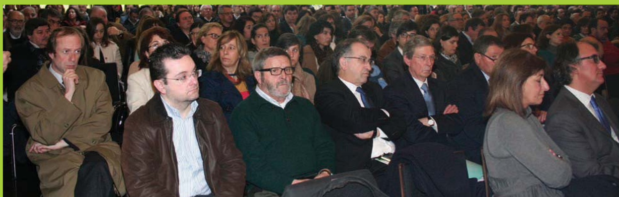
Centenas de autarcas e técnicos interessados em entender melhor a lei 75/2013