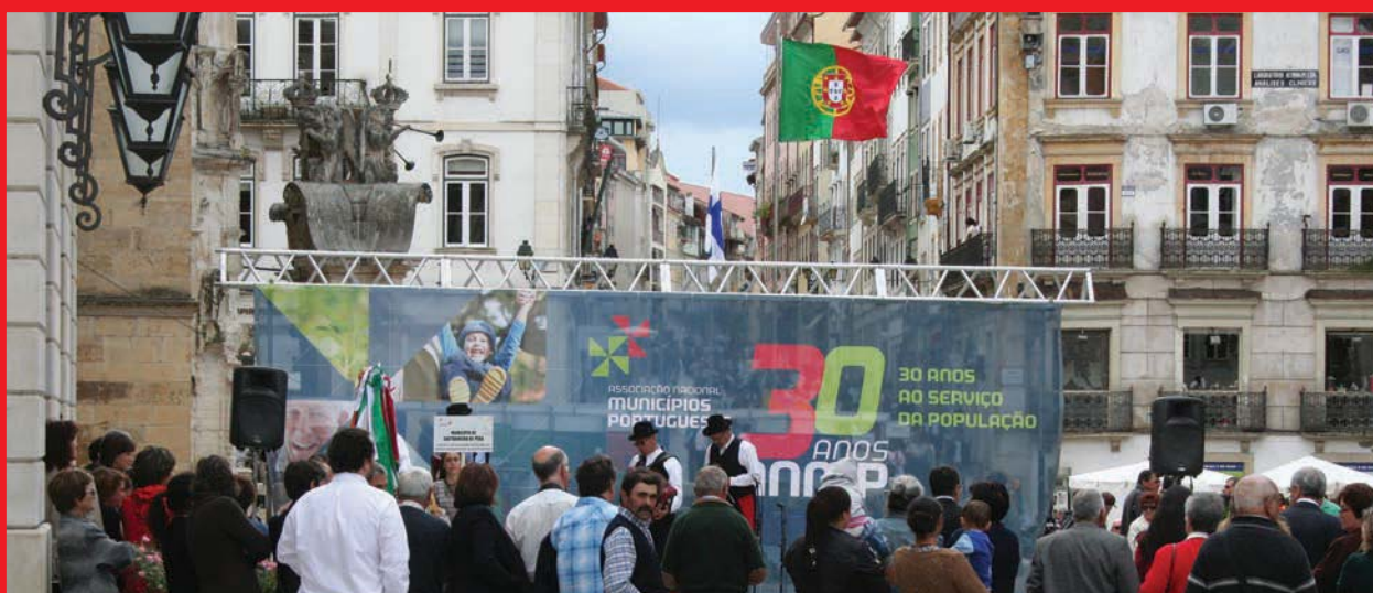
A festa desceu à baixa de Coimbra