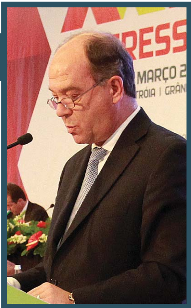
Carlos Carreiras Presidente da Mesa do Congresso e Presidente da Câmara Municipal de Cascais

mandatado pelos cidadãos – que ocupe o espaço vazio entre os presidentes de Câmara e os ministros. Este órgão deveria responsabilizar-se pelo que é claramente supramunicipal e assumir competências que são impossíveis de serem bem exercidas se continuarem no Governo central, mesmo que de forma indireta.[...].