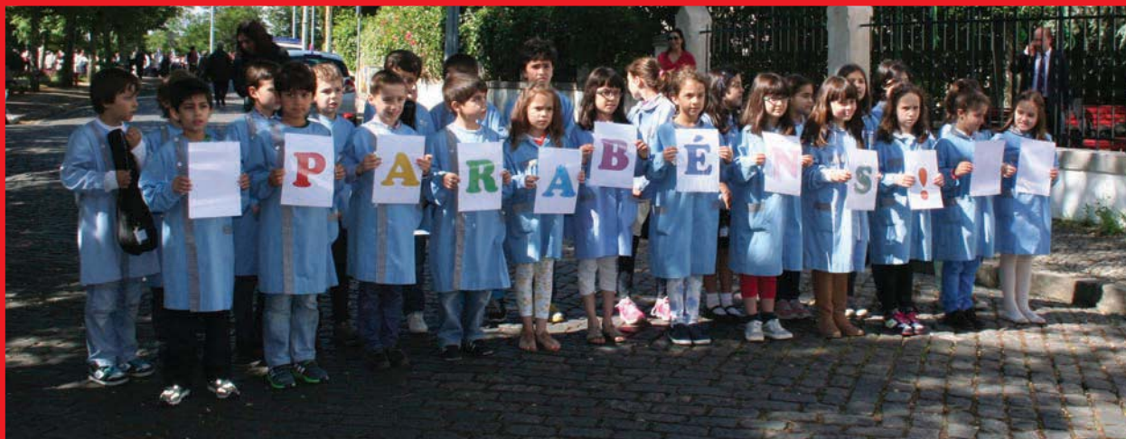
As crianças do 1.º Jardim-Escola João de Deus, a mais antiga escola primária do país, vieram dar os parabéns

Na Baixa, teve lugar um dos momentos simbólicos mais relevantes do dia: a homenagem a D. Afonso Henriques, fundador da nacionalidade. A coroa de flores colocada junto ao túmulo do primeiro rei de Portugal procurou mostrar o reconhecimento dos autarcas portugueses pelo monarca que primeiro contribuiu para a coesão territorial nacional.