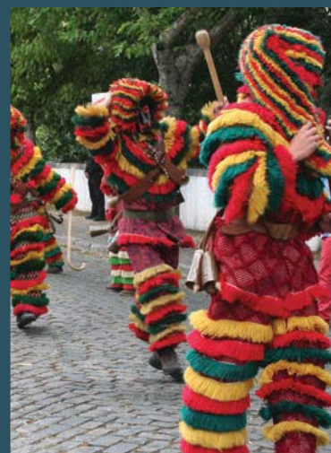
Coletividades de todo o país vieram à festa