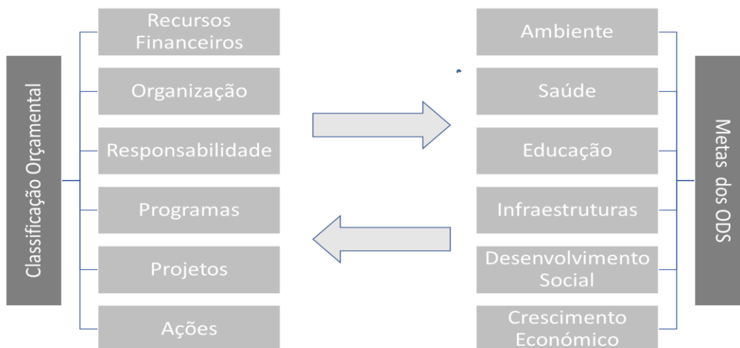
Figura 3: Matriz de alinhamento entre a classificação orçamental e as metas dos ODS