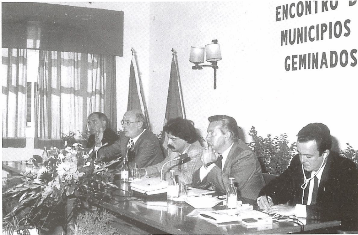
A mesa que presidiu aos trabalhos do encontro.