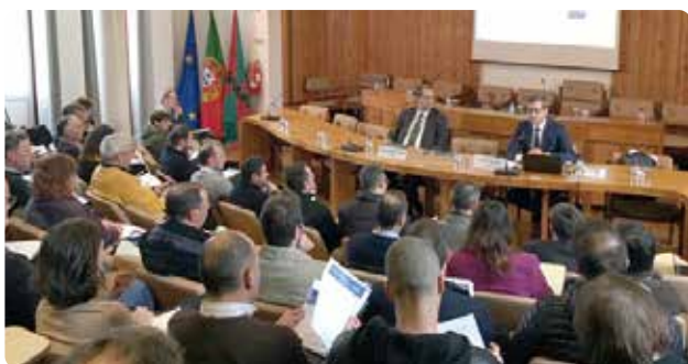
A apresentação em Coimbra.

no sentido de que inibia os agentes locais de prestarem contas às populações locais sobre os assuntos que lhe dizem direta e estritamente respeito, como inibia estas populações de exercerem (e até de exigirem o exercício), ante os agentes do poder local, os direitos constitucionais individuais e coletivos de informação e participação nos assuntos locais.