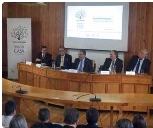
A entrega dos apoios.

A ANMP, para além de integrar, com a Santa Casa da Misericórdia de Lisboa e o Instituto de Segurança Social, o Conselho de Gestão do Fundo Recomeçar, empenhou-se, desde o início, neste trabalho, integrando o júri que