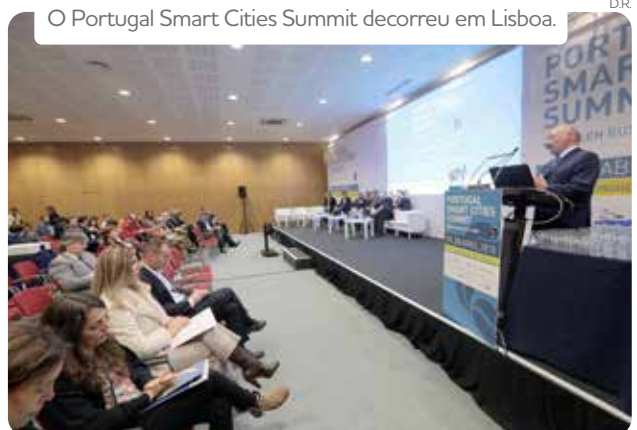
O Portugal Smart Cities Summit decorreu em Lisboa.