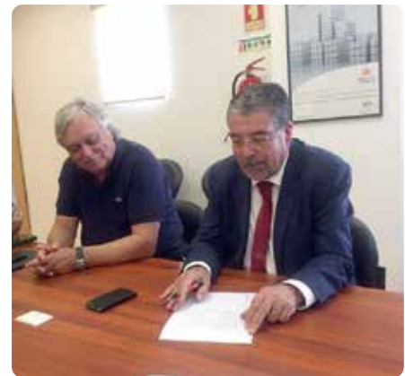
Assinatura da escritura

A FEFAL realiza ações de informação, cursos de formação, atividades de investigação, de assessoria técnica, de cooperação técnica internacional, e promoverá a edição de estudos especializados em temáticas relevantes para o desenvolvimento e inovação nas autarquias locais.