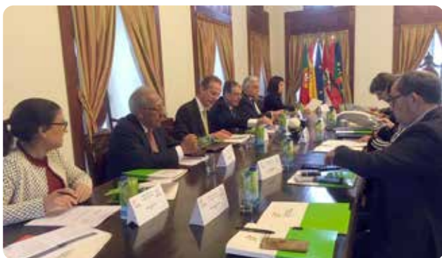
A delegação portuguesa, em primeiro plano.