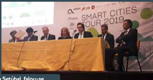
Em Setúbal, falou-se da cidade inclusiva.

A Smart Cities Tour terminou com a Cimeira dos Autarcas realizada no âmbito do evento Portugal Smart Cities Summit, no dia 21 de maio, na FIL, em Lisboa. O presidente da ANMP Manuel Machado abriu esta Cimeira que reuniu autarcas de todo o País e permitiu colocar em comum o que cada Município já faz em matéria de inteligência urbana, bem como perspetivar um futuro mais autonomizado, seja nas cidades, seja nas zonas rurais.