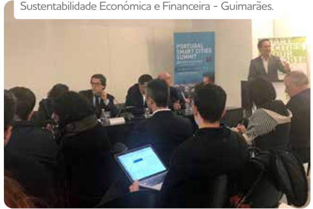
Sustentabilidade Económica e Financeira - Guimarães.