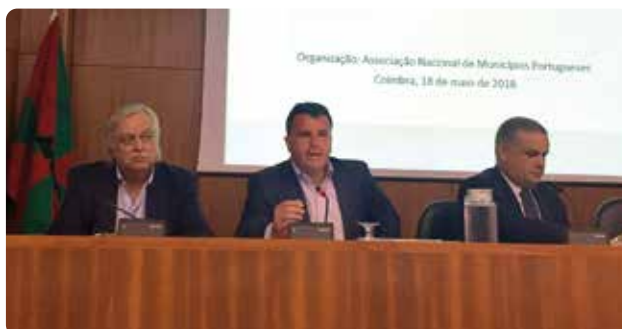
O seminário em Coimbra.

Estes seminários, realizados em articulação com a ERSE – Entidade Reguladora dos Serviços Energéticos – contaram com a participação de quase três centenas de representantes dos municípios e de entidades intermunicipais.