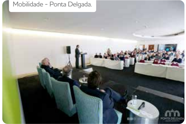
Mobilidade - Ponta Delgada.