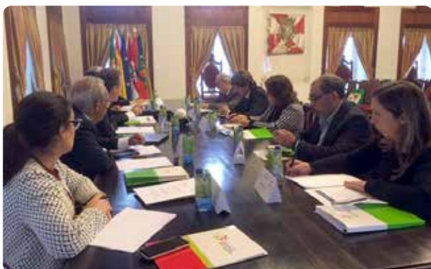
A delegação espanhola, em primeiro plano.