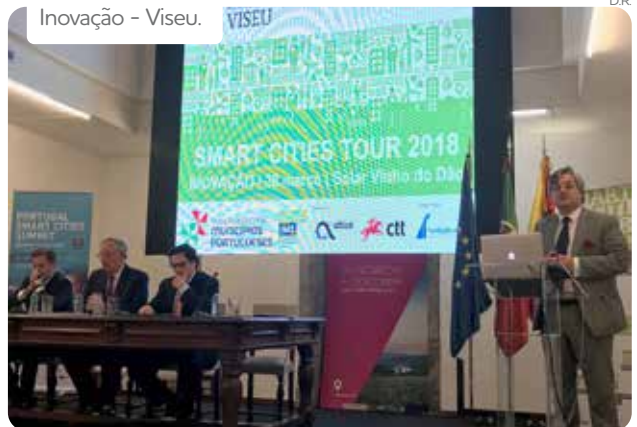
Inovação - Viseu.