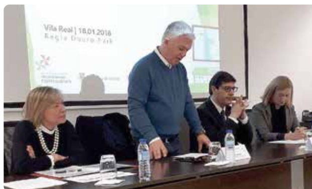
Um das cinco apresentações.

▲ A ANMP realizou um conjunto de sessões, em colaboração com a Secretaria de Estado da Internacionalização, a Aicep Portugal Global e a Aicep Global Parques, dirigidas especificamente a eleitos e técnicos dos municípios e das entidades intermunicipais, visando identificar formas de colaboração para reforçar a atratividade dos territórios em matéria de captação de investimento externo.