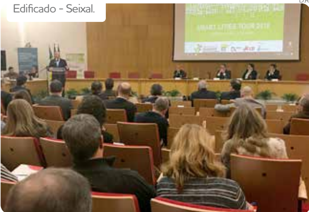
Edificado - Seixal.