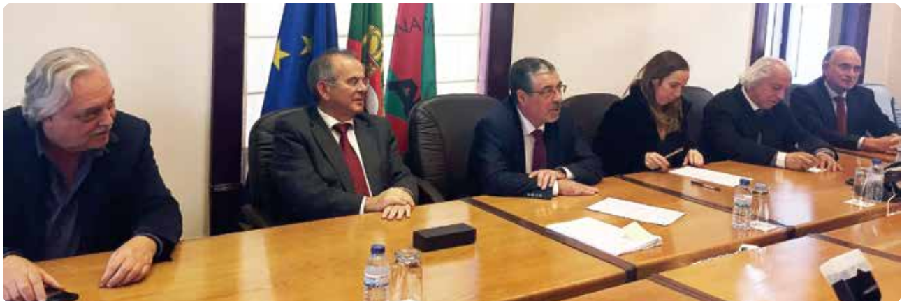
Assinatura do contrato de delegação de competências da DGAL para a FEFAL.