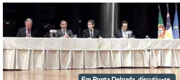
Em Ponta Delgada, discutiu-se as alterações climáticas.