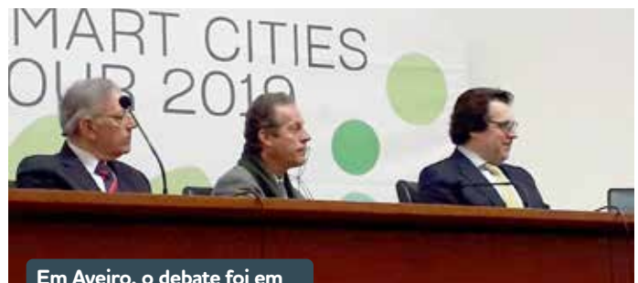
Em Aveiro, o debate foi em torno da mobilidade suave.