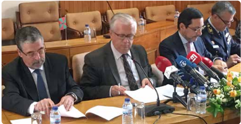
ANMP e Governo assinando o compromisso.

▲ O Conselho Diretivo da Associação Nacional de Municípios Portugueses aprovou a 23 de janeiro de 2018 uma posição relativa ao Projeto de diploma que definiu os critérios aplicáveis à gestão de combustível nas faixas secundárias (de gestão de combustível) no âmbito do Sistema Nacional de Defesa da Floresta contra Incêndios. Esta posição, aprovada por todos os membros do Conselho Diretivo, seguiu para o Governo e para todos os municípios e, na sequência desta tomada de posição, a ANMP solicitou uma reunião ao Governo e reuniu com os responsáveis pela pasta e, posteriormente, as-