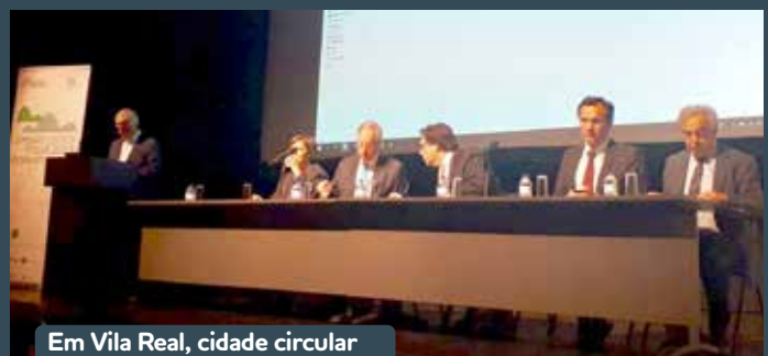
Em Vila Real, cidade circular foi o tema do encontro.