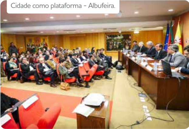
Cidade como plataforma - Albufeira.