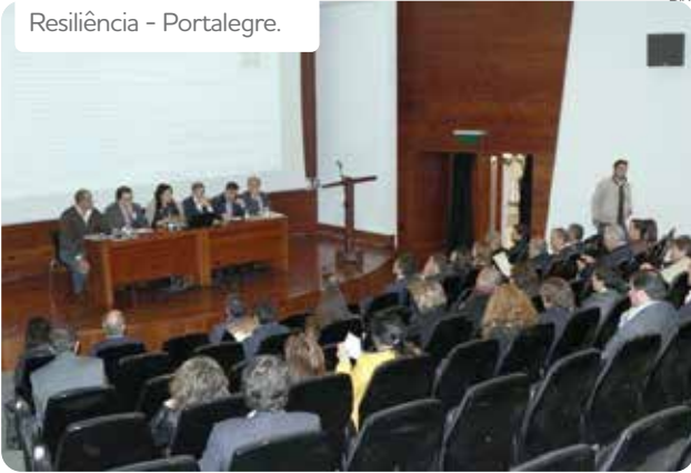
Resiliência - Portalegre.