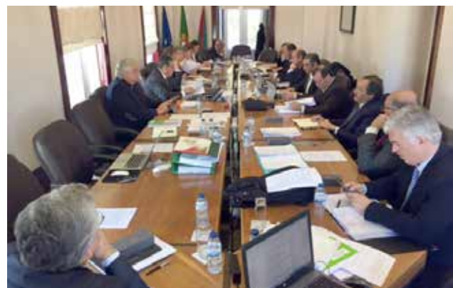
O Conselho Diretivo exigiu a intervenção do Governo na questão dos CTT

A ANMP exigiu, por isso, a intervenção do Governo