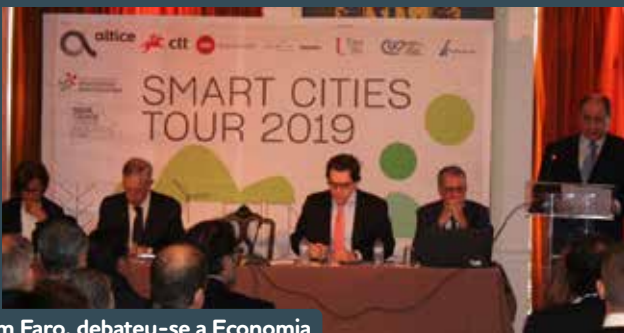
Em Faro, debateu-se a Economia e Inovação Tecnológica.

A edição da Smart Cities Tour 2019 arrancou a 16 de janeiro em Faro. Esta primeira sessão da 3.ª edição deste evento, organizado pela Associação Nacional de Municípios Portugueses (ANMP), através da Secção de Municípios Cidades Inteligentes, em parceria com a NOVA Cidade - Urban Analytics Lab, teve como tema a “Economia e Inovação Tecnológica”.