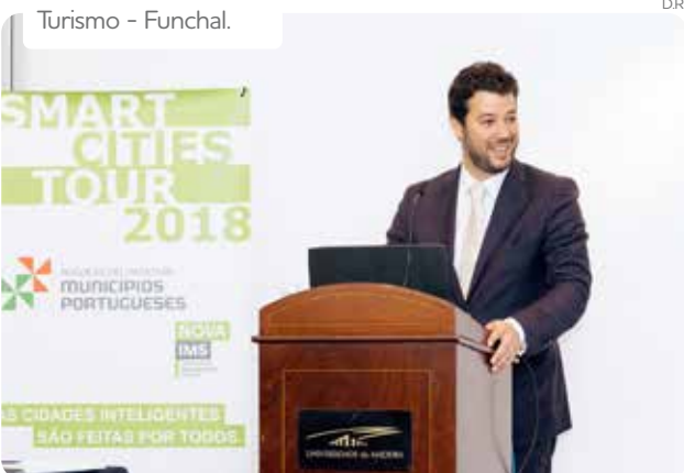
Turismo - Funchal.