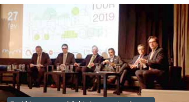
Em Lisboa, o tema foi cidade como plataforma.