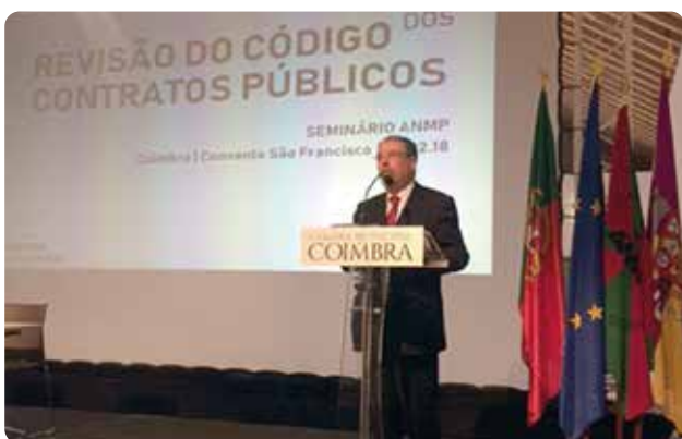
Manuel Machado na abertura do Seminário.

▲ A ANMP analisou a 22 de janeiro de 2018, num Seminário, em Coimbra, a Revisão do Códigos dos Contratos Públicos (CCP). O Presidente da ANMP, Manuel Machado, abriu o Seminário e alertou para a necessidade da criação de uma plataforma eletrónica para apoiar as entidades na aplicação do Código revisto dos